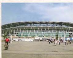
エコパスタジアム 約6.3km(車で約12分)