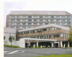
中東遠総合医療センター 約8km(車で約16分)