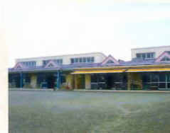
こども広場あんり 約4.7km(車で約9分)