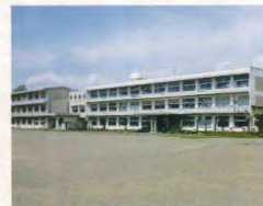
和田岡小学校 約0.7km(車で約1分)