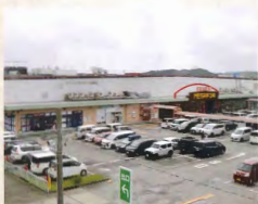
MEGAドン・キホーテ 約6.3km(車で約12分)