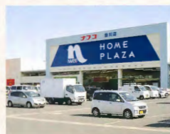
ホームプラザ ナフコ 約2.2km(車で約4分)