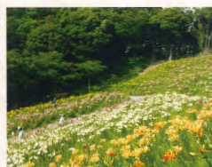
可睡ゆりの園 約6km(車で約12分)