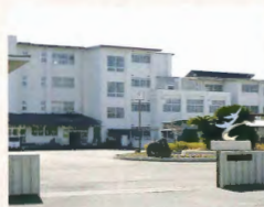
桜が丘中学校 約2.7km(車で約5分)