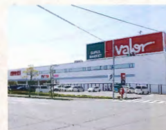
パロー 約4.5km(車で約9分)