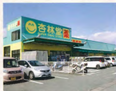
杏林堂 約3.3km(車で約6分)