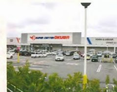
スーパーセンターオークワ 約3km(車で約7分)