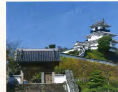
掛川城 約7km(車で約14分)