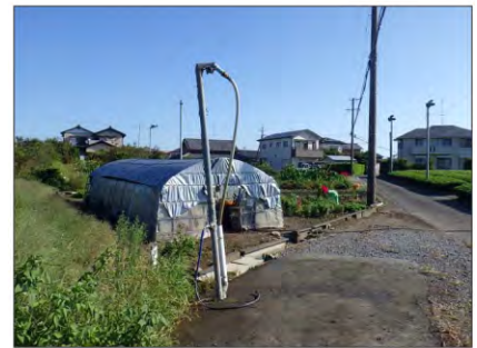
写真 施工前(給水スタンド)