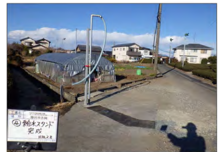
写真 給水スタンド完成