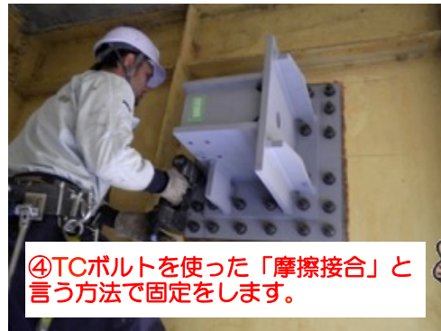
④TCボルトを使った「摩擦接合」と言う方法で固定をします。