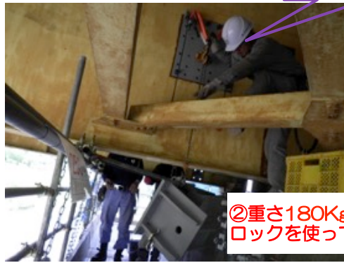
②重さ180Kgの部材を、チェーンブロックを使って取り付けます。