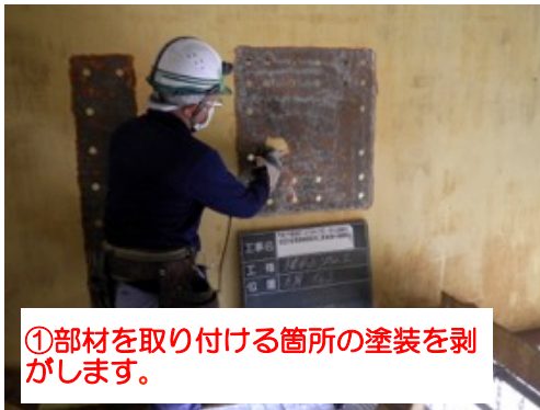
①部材を取り付ける箇所の塗装を剥がします。