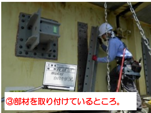
③部材を取り付けているところ。