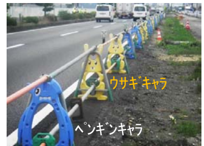
キャラクターバリード

反射テープ・点滅灯、も付いて います。点滅灯は夜間、遠く からでもよく目立ちます。