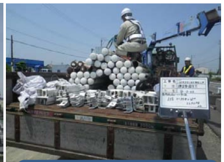
搬出の際も数量の重さを確認して 過積載の無いように積み込みし運 搬しました。

クレーン付きのトラックに柱を装着し、トラックが傾かないようにし、滑車を追加してガードレール支柱を引き抜きました。