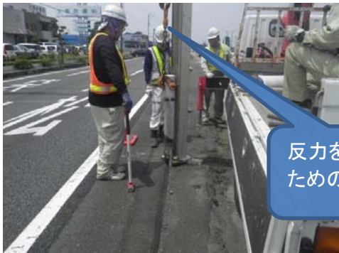
反力を得る ための柱