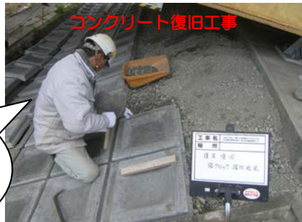
コンクリート復旧工事