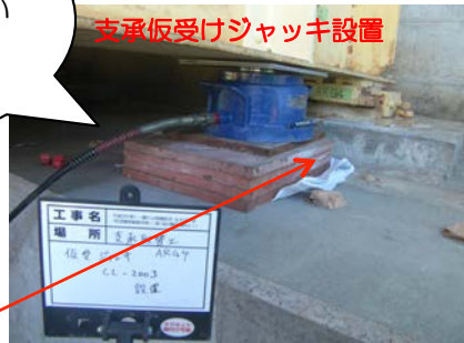
支承板受けジャッキ設置

古い支承を取替えるためにジャッキを使用して桁を浮かせながら、新しい支承を設置します。