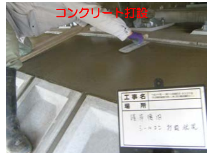
コンクリート打設