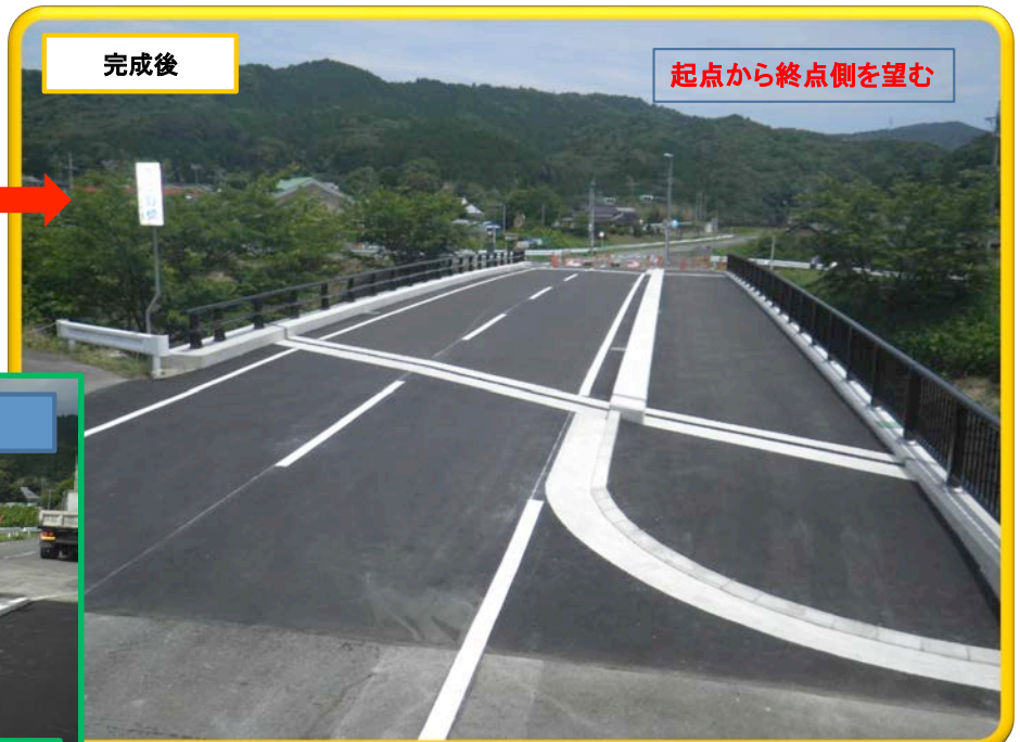
起点から終点側を望む