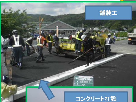
コンクリート打設