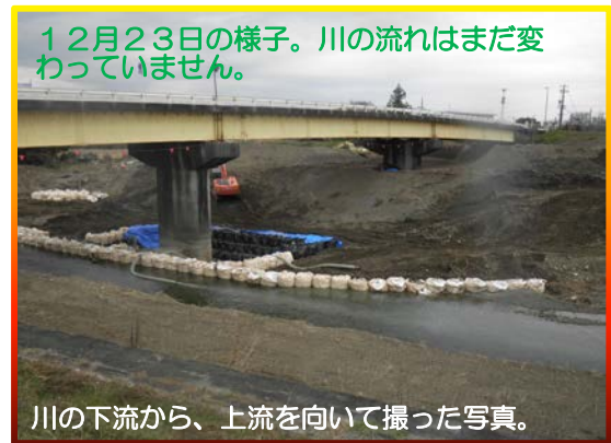
12月23日の様子。川の流りはまだ変 わっていません。