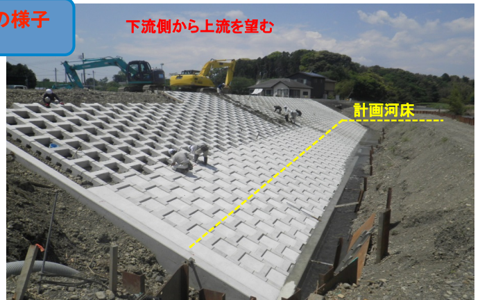
下流側から上流を望む